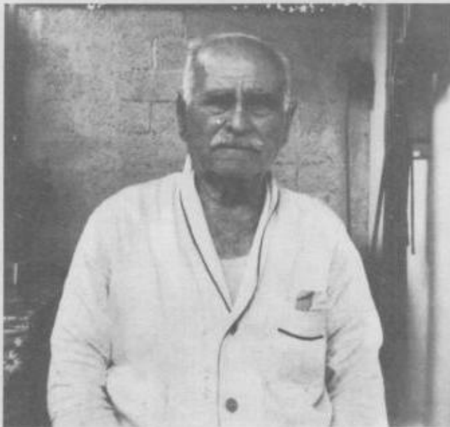
Στην αυλή του σπιτιού του στην Καρδίτσα, τον Ιούλιο του 1985