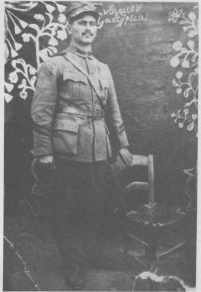
«Ενθύμιον Φιλαδελφείας 5/2/21». Στρατιώτης στη Μικρά Ασία.

– Το 1918. Παρουσιάστηκα στο 18 έμπεδο στη Λάρισα. Από κει στα Τρίκαλα, κι από κει στην Καβάλα στις Ελευθερές. Ήμουν στην 19B μοίρα πυροβολικού. Ήμουν δεκανέας βολής, με δίοπτρα. Ήμουν και σαλπικτής. Είχα και το άλογο. Δεν είχαμε ασύρματο τότε. Άμα ήταν κανένας κίνδυνος, ειδοποιούσε με τη σάλπιγγα. Εκεί προσκοληθήκαμε στο 5/42 Σύνταγμα ευζώνων του Πλαστήρα, 13η Μεραρ-