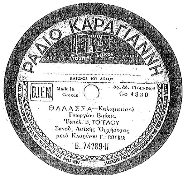
- Η επικέτα του δίσκου που περιέχει το τραγούδι "ΘΑΛΑΣΣΑ" του Γ. Βούκα.